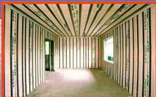
グリーン購入法適合資材