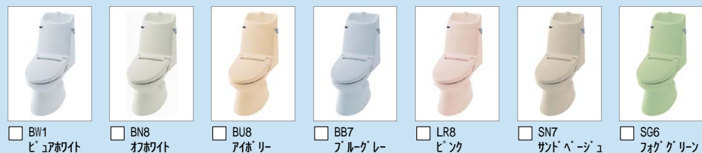
□ BW1 ビュアホワイト □ BN8 わかり白 □ BU8 アイボリー □ BB7 ブルージェ □ LR8 ピンク □ SN7 サンドベージュ □ SG6 フォググリーン