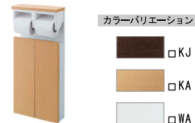
埋込収納棚 (紙巻器付) TSF-210/KA (色別決)