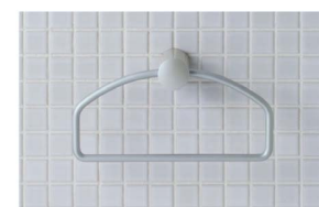
プレノスシリーズ KF-70D