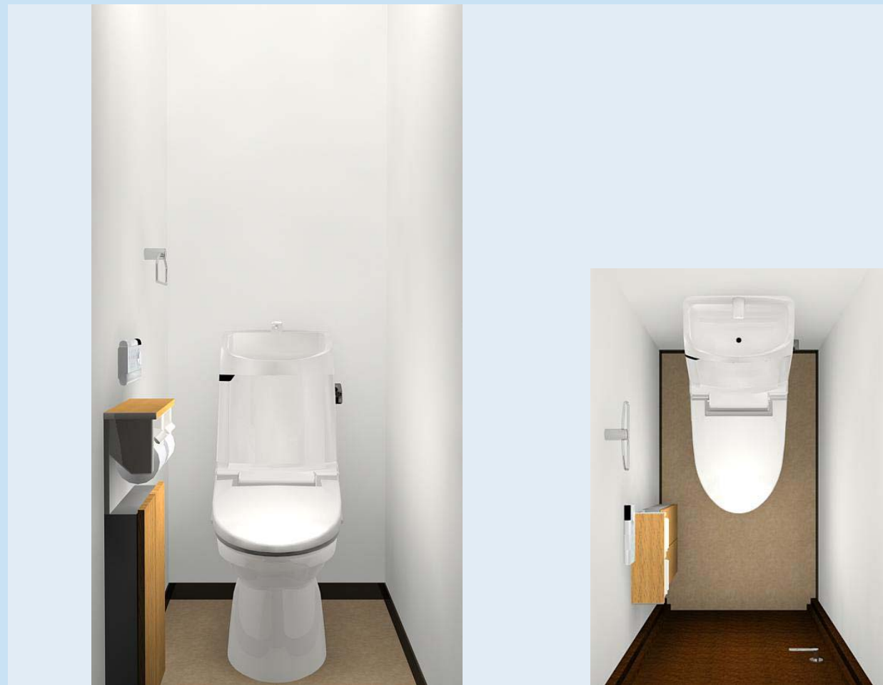
0.4坪プラン (780×1,235mm) CG合成によるイメージ画像です。